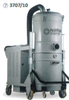
Nilfisk® 社製 大型集塵機 HEPAフィルター搭載