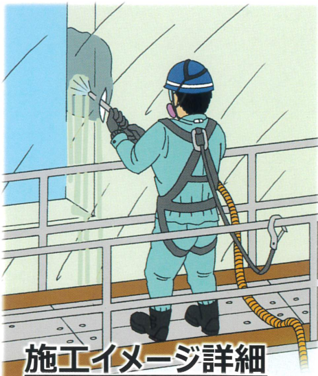
施工イメージ詳細